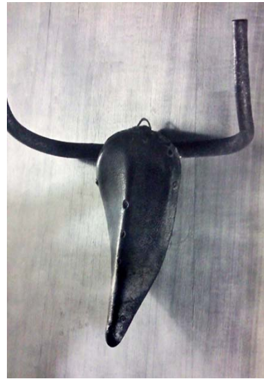
- : (2)