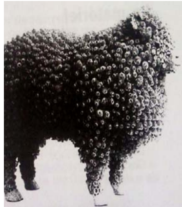
1952 - - - :(15)